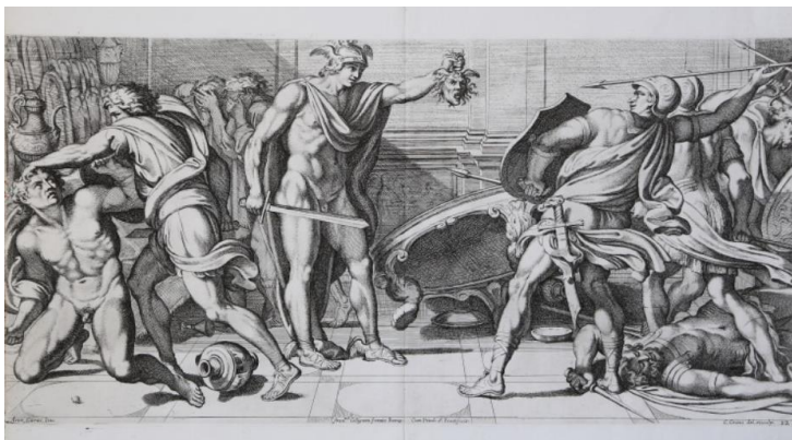
Figura 1. Incisione esposta in Museo

Giovanni Pietro Bellori, nel commento a stampa relativo a questa immagine, così descrive la scena: "Perseo con la testa di Medusa in mano, si difende, e fa convertire in pietra Tessalo, e li compagni, che lo assaliscono per amore di Andromeda. Gli amici di Perseo chiudendosi gli occhi indietro con le mani, et è bellissimo l'atto di colui genuflesso, il quale, mentre si raccomanda all'inimico, che l'afferra ne' capelli, e sta per troncargli la testa, in tanto s'indurisce in sasso, e con la morte fugge la morte"