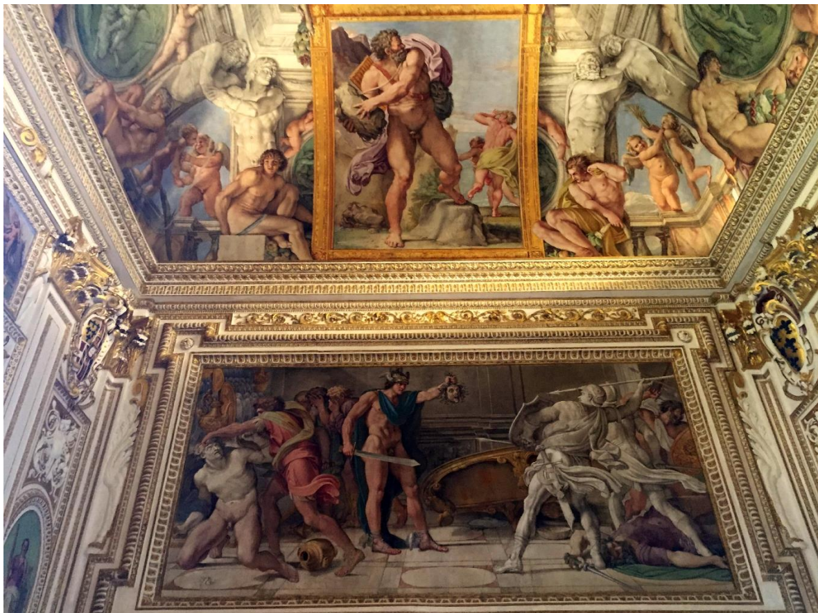
Figura 3. Galleria Carracci, Roma